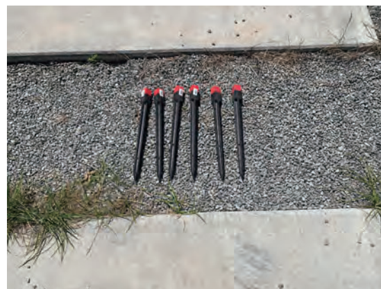
埋設管位置目印 (最終目印)