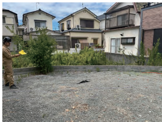
土かぶり測定風景 (60° )