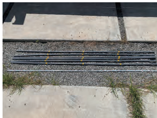
埋設管位置目印 2m (50cm ごとに黄色印)