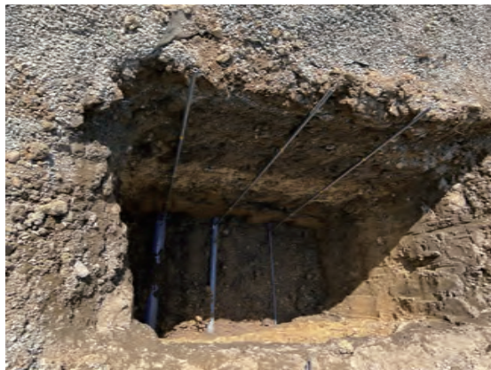
深度 2m 埋設