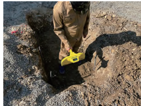
AML Pro 使用風景