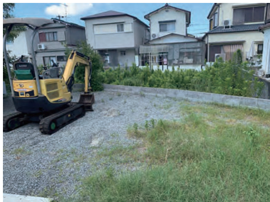
埋設管テストサイト風景①