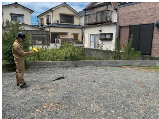
土かぶり測定風景 (45° )