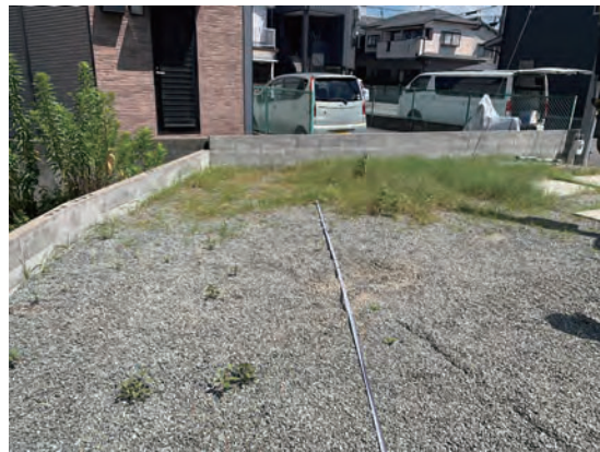
埋設管テストサイト風景②