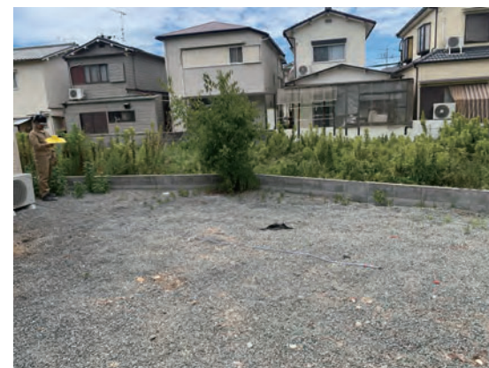
土かぶり測定風景 (70° )