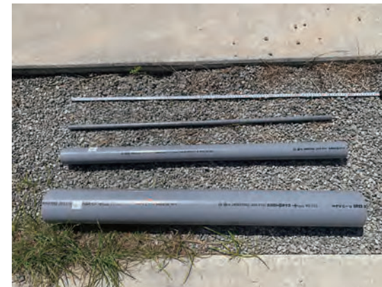
埋設管 1m (VP13、VU50、VU100)